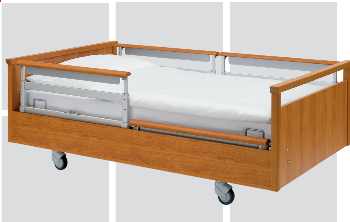
Univerzální pečovatelské lůžko